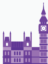
Les élections générales/législatives